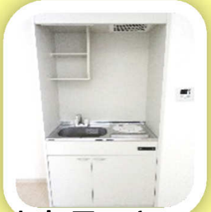
お部屋のキッチン